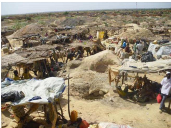
Vue d'un site aurifère de Komabangou en 2014 au Niger