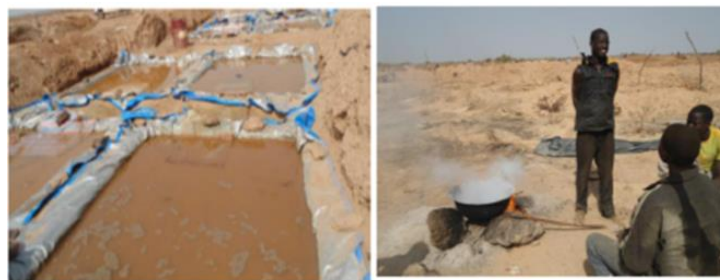
Bassins de cyanuration, site de Nbganga, Niger