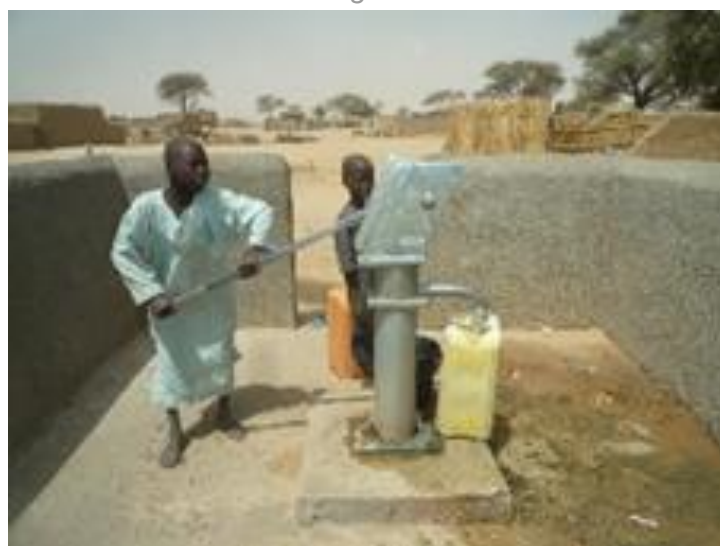
Borne fontaine des villages environnants